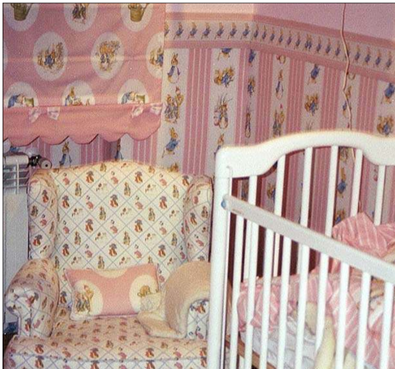
La interiorista fue quien supervisó los trabajos personalmente.